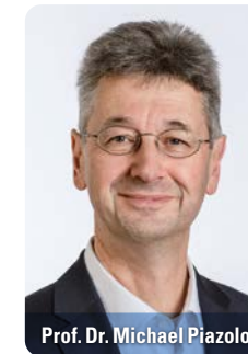
Prof. Dr. Michael Piazzolo